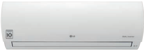
Prestige DUAL Inverter